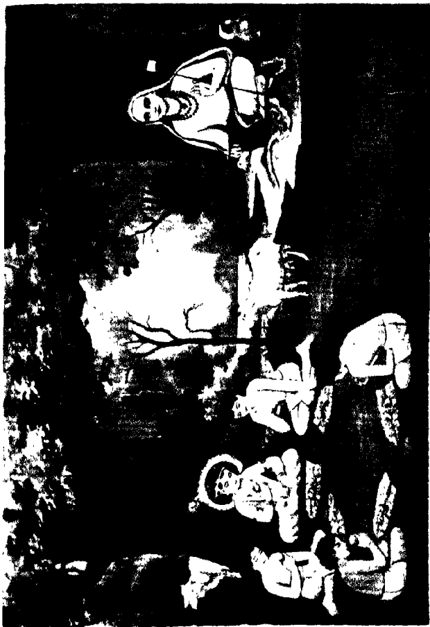
श्रीलंका के श्वेत बाल-श्रमण